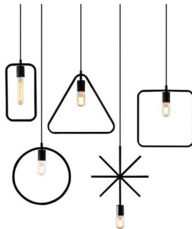
Figure 2 Suspendisse a placerat lacus, a imperdiet lorem.

Proin et tincidunt magna. Sed sagittis dolor justo. Nunc ac dictum mi. Curabitur commodo lectus ac metus consectetur, et tristique nisi semper. Etiam suscipit ut ante in dignissim. Orci varius natoque penatibus et magnis dis parturient montes, nascetur ridiculus mus. Aliquam finibus massa commodo finibus pulvinar. Duis a pretium diam. Cras pharetra condimentum consectetur. Cras orci enim, elementum at pellentesque nec, eleifend sed odio. Vivamus luctus mollis nunc, in faucibus orci rutrum id. In eu eleifend ipsum. Aenean quis tempus lacus, in dignissim nibh. Nunc facilisis venenatis odio, a molestie magna blandit eu.